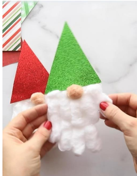
Allegato 4. (1)