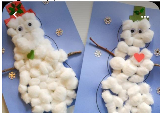
Cotton Ball Snowman