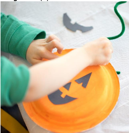
Allegato 3. (1)